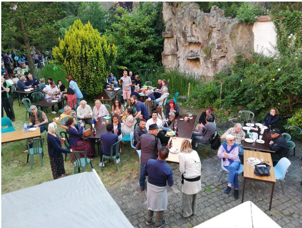
Fête de la diversité, juin 2020

A travers ces différents axes de travail, nous travaillons au service d'un projet de société interculturelle qui, on l'aura constaté revêt des dimensions tantôt sociale, tantôt humanitaire, tantôt politique, tantôt culturelle,... bref une complexité et des enjeux qui nécessitent d'être traités avec force, conviction et organisation. Fin 2019 nous avons d'ailleurs procédé au recrutement d'une chargée de projets qui, forte de son expérience et de son Master en Ingénierie et action sociales, viendra renforcer les compétences des membres fondateurs dès janvier 2020.