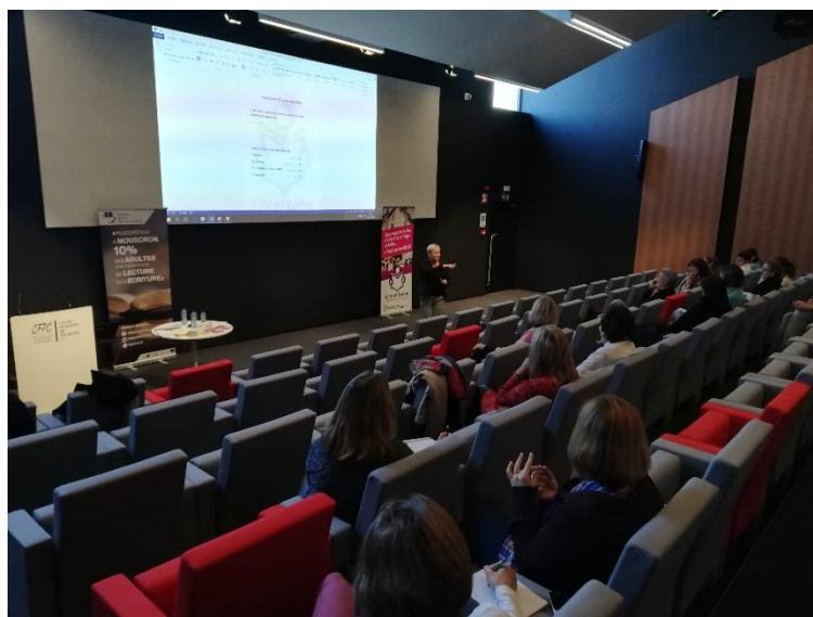
Séance de sensibilisation des personnels soignants au CH Mouscron