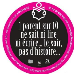
Illustration d'un sous-bock diffusé en 2019 dans les établissements Horeca de Wapi afin de rappeler la persistance de l'illettrisme

Nous collaborons également avec la bibliothèque provinciale de Tournai et la Bibliothèque de Beloeil qui nous mettent à disposition locaux et ressources permettant d'organiser des séances de formation.