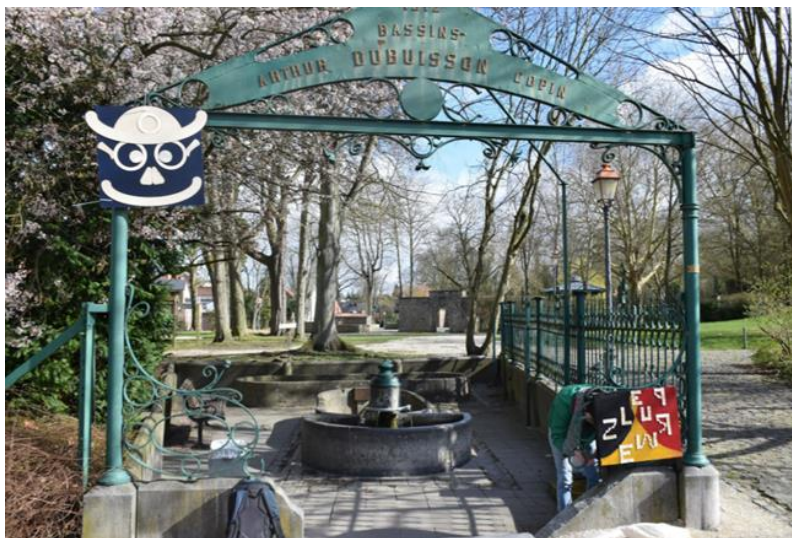
La Langue française en fête, Péruwelz, mars 2019

Un des enjeux que nous poursuivons est de permettre aux apprenant.e.s qui le souhaitent de s'engager dans des espaces de militance qui rencontrent leur choix d'engagement. En parcourant le présent rapport, nous avons pu constater que cet investissement s'est traduit en 2019 de différentes façons sur différents thèmes. Ainsi des apprenant.e.s se sont donc investi.e.s dans des actions collectives visant à prendre en compte les personnes infrascolarisées dans le secteur de la santé. Par l'expression artistique (théâtre avec la troupe du Préau), l'interpellation dans l'espace public (diffusion du Journal avec les Motivés du partage), la proposition d'adaptation de documents (Solidaris, Chwapi). Elles ont également pris une place dans un événement culturel « Tournai Ville en Poésie » en exposant leurs œuvres et rendant légitime leur présence et la reconnaissance d'une expression « populaire » dans une telle organisation. Ce fut le cas en 2019 également à Péruwelz où des apprenant.e.s ont contribué à l'évènement « La Langue française en fête » organisé par Arrêt 59. Cette participation s'est effectuée par la réalisation de panneaux colorés (détournement de noms de rues) accrochés dans différents endroits de la ville.