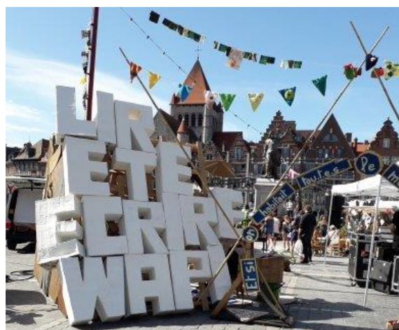
Les Inattendues, Tournai, août 2019

En conclusion je dirais que le travail en groupe mixte est un atout majeur dans la mise en place des actions à mener par lire et écrire, nous sommes passés d'un laboratoire à idées où les ingrédients nous paraissaient explosifs et instables (parole, égalité, légitimité, hiérarchie, engagement) à un modèle efficace et démocratique où chacun a sa place et sa possibilité d'agir. Evidemment ce modèle comporte des écueils, comme la place qu'il peut prendre dans le timing des formateurs et bénévoles, en effet les premières invitations à participer ont eu plus de succès que les suivantes et les participants se sont fait (un peu) plus discrets. Il serait peut-être judicieux de poser la question aux travailleurs et aux bénévoles afin de savoir si d'autres moments seraient plus opportuns ou si la direction pense (comme moi) que ce groupe mixte devrait être obligatoire, car je pense qu'il y va de la conception que l'on a du Mouvement en tant que tel ainsi que de l'importance d'agir pour celui-ci, sans oublier que les formateurs ont énormément de travail, ce groupe mixte ne doit pas être une contrainte mais un moment à part, où se réunir doit être un plaisir qui pousse à agir pour nos convictions.