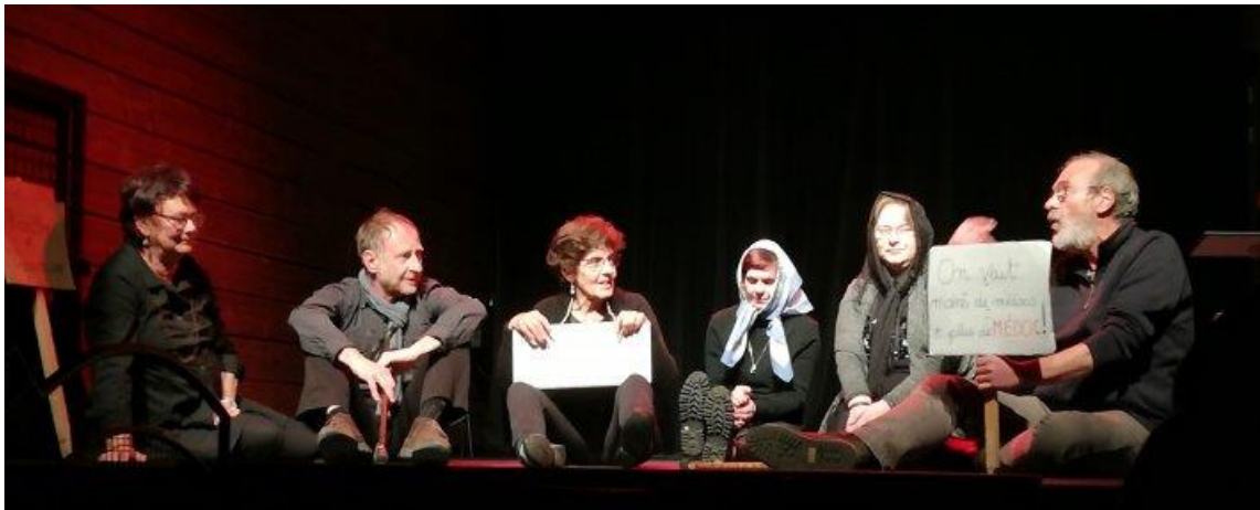
La troupe du Préau en action, Comines, avril 2019